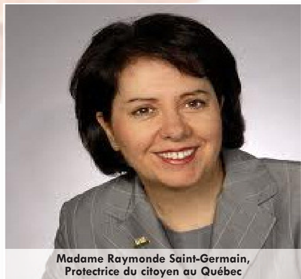
Madame Raymonde Saint-Germain, Protectrice du citoyen au Québec